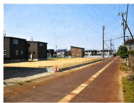
北側から西側に向けて撮影 左側に団地が出来ます。