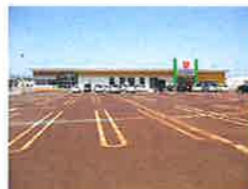
ウオロク東新保店