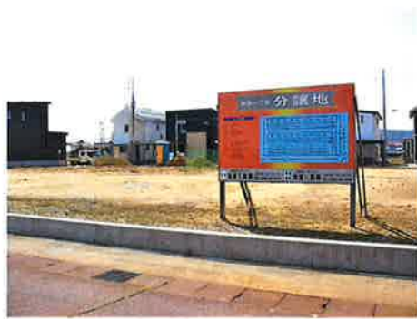
北側から南側に向けて撮影 正面に団地が出来ます。