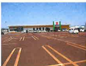
ウオロク東新保店