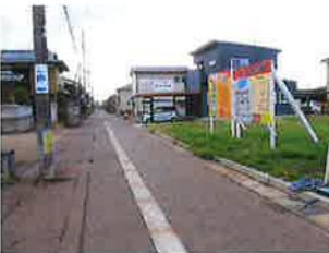
東側から南側に向けて撮影 右側に当該物件があります。