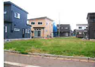
南側から西側に向けて撮影 (すぐ右側に看板)