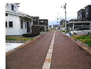
西側から東側に向けて撮影 この道路は団地の中央にあります。