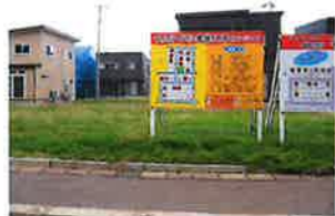
南側から北側に向けて撮影