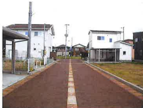
北側から南側に向けて撮影 右手前にN○19の区画があります。