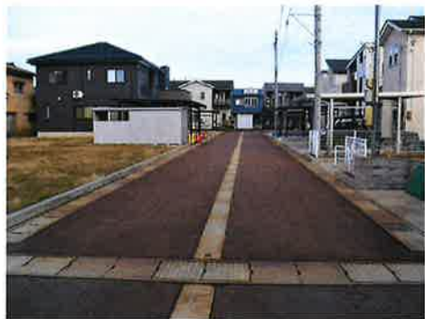
南側から北側に向けて撮影 左手前の更地が最後のN○19です。