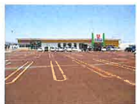
ウオロク東新保店