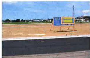
南側から北側に向けて撮影 正面に団地が出来ます。