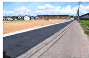
南側から東側に向けて撮影 左側に団地が出来ます。