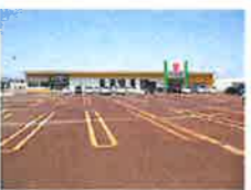
ウオロク東新保店