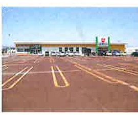
ウオロク東新保店