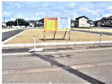
正面 西側から東側に向けて撮影