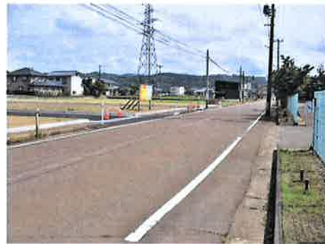
前面道路 右側に月岡小学校があります。