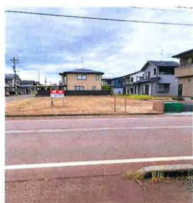
東側から西側に向けて撮影 東側の道路 正面の土地