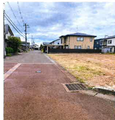
東側から西側に向けて撮影 南側の道路 右に当該物件