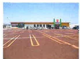
ウオロク東新保店